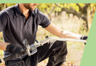
Met één klik wissel je van opzetstuk